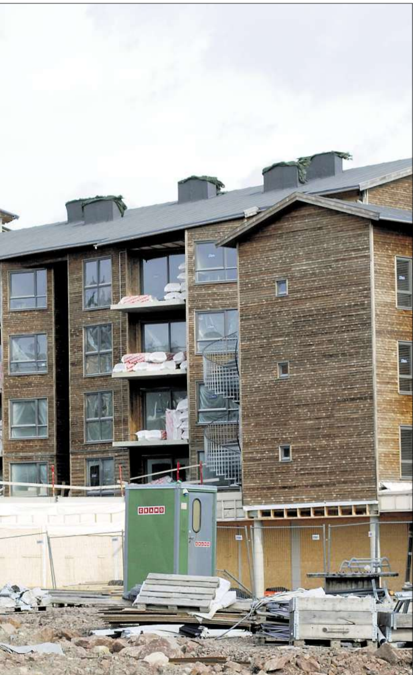
TVANGSSALG: Det halvferdige Estatia-prosjektet på nesten 32.000 kvadratmeter legges ut på tvangssalg.